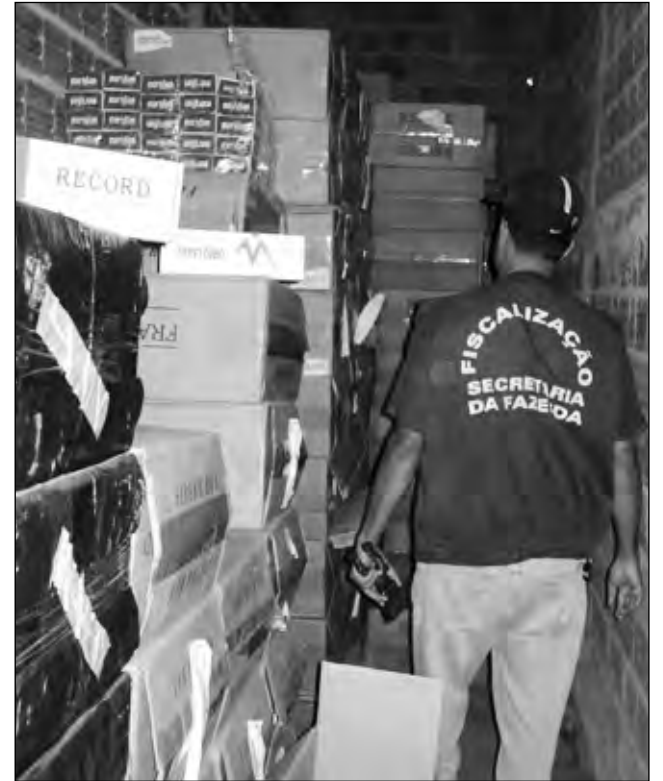
FISCAL fazendário na operação posta em prática em Bezerros

tor é elevada por causa, principalmente, das baixas penas para crimes de descaminho, além dos altos preços praticados pelo mercado formal com o objetivo de inibir o consumo e proteger à saúde da população. Em Pernambuco, o mercado ilegal representa 36% (cerca de R$ 5 milhões) e o contrabando responde por 15% (cerca de R$ 2 milhões).