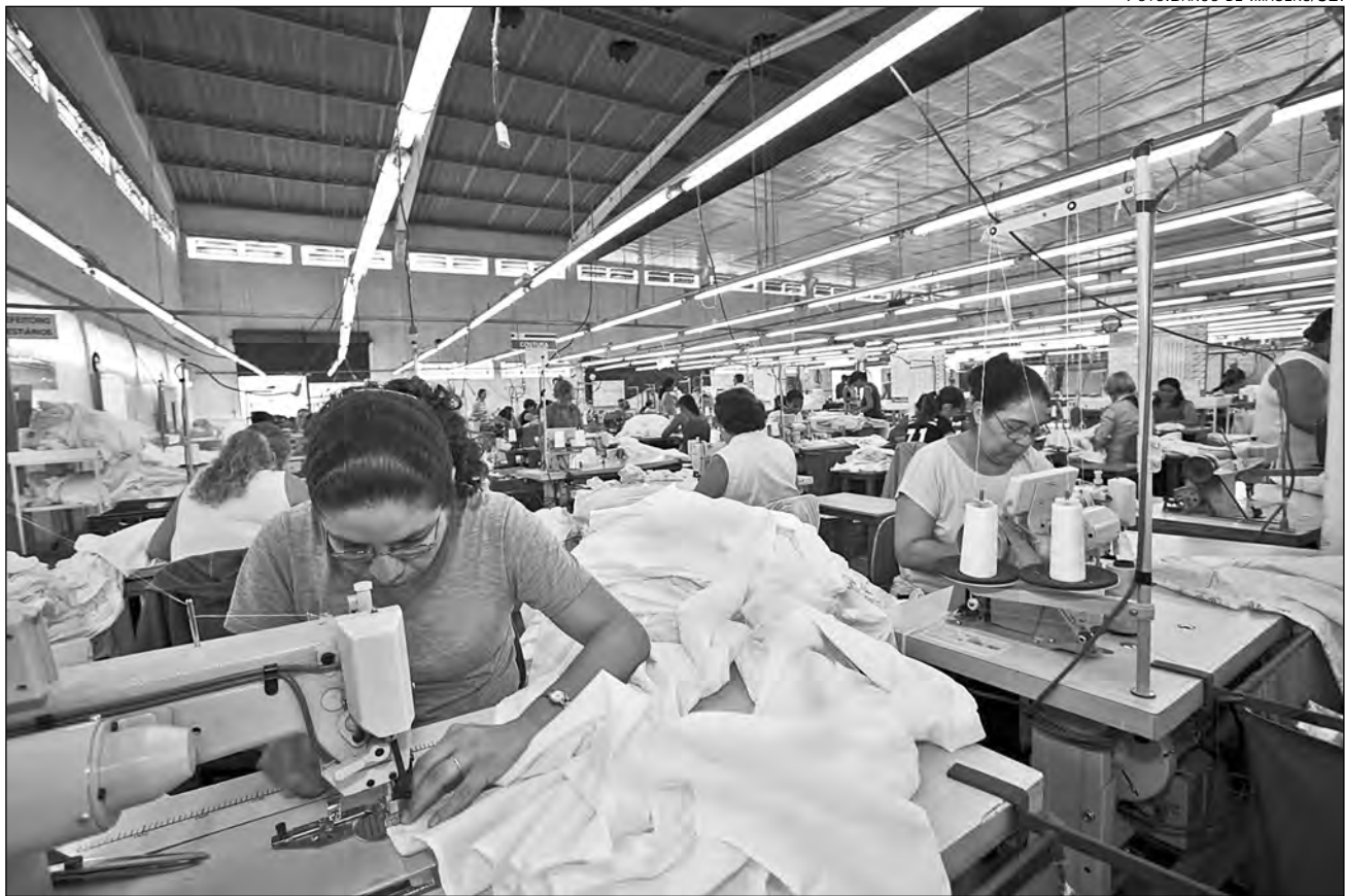
A OFERTA de postos de trabalho na indústria de Pernambuco cresceu 4,2%, diante uma queda de 0,5% no País e de 0,4% na região NE

Os segmentos econômicos que mais contribuíram para o desempenho foram os de alimentos e de bebidas, que apresentaram um aumento de 8,1% no total de pessoas ocupadas, e de produtos químicos, com crescimento de 11,5%. No resultado acumulado dos últimos doze meses, o nível de emprego na indústria pernambucana apresenta um crescimento de 5,2%, maior que a média brasileira, de 0,8%, e que a da Região Nordeste, de 1,1%.